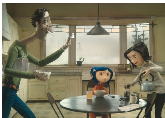
Padres de Coraline