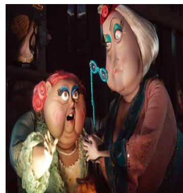
Srtas. Spink y Forcible